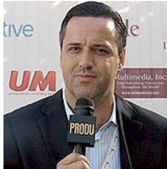
Taratuta: La asistencia fue un 10% superior a lo esperado (Clic para agrandar)